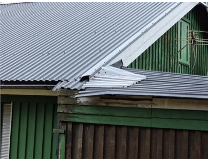
Garagetak har uppenbara brister.