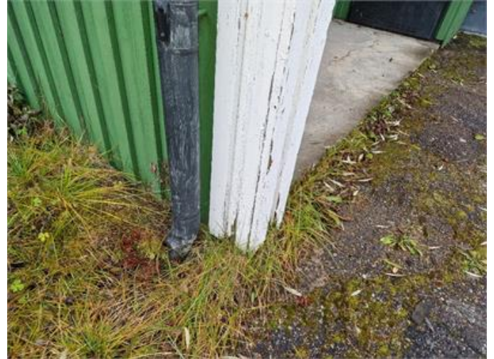
Delar av fasad är marknära.