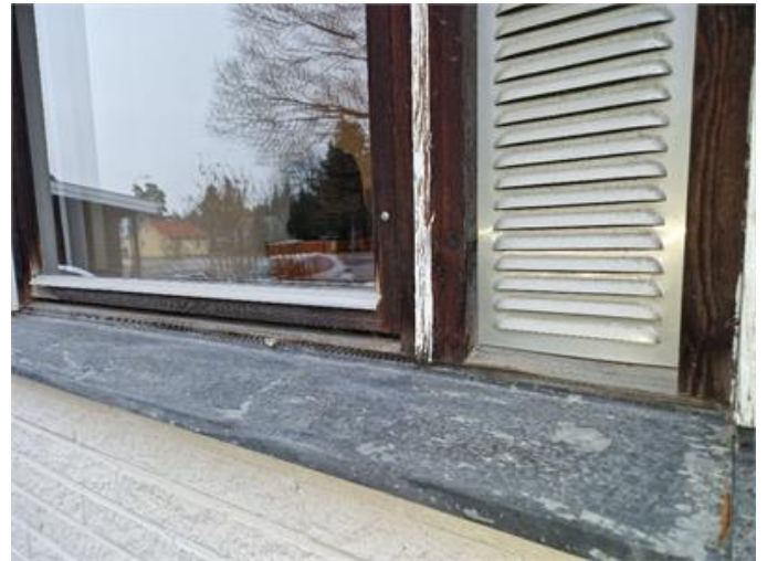
Fönster är i behov av målning och underhåll.