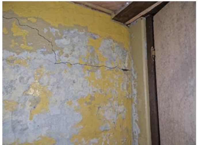
Sprick i mur mellan hus och garage.