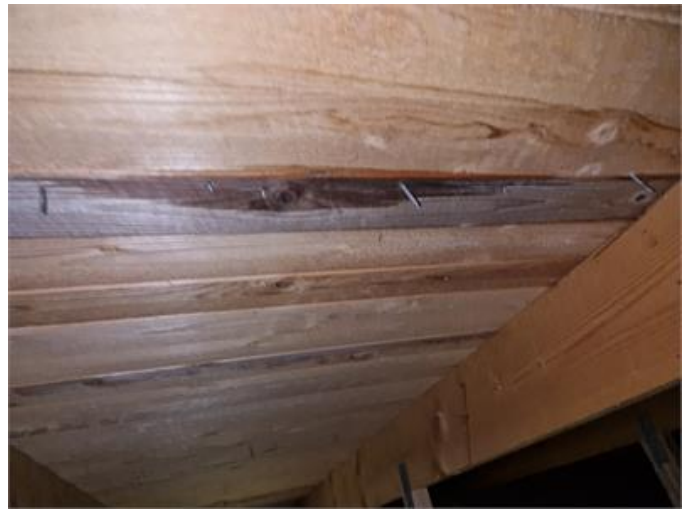
Inläckage noteras på vind.