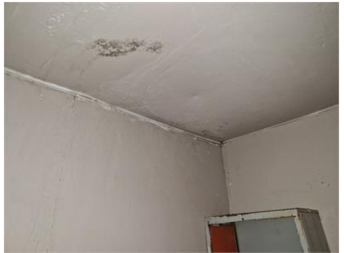
Fuktskada i tak konstateras i garage.