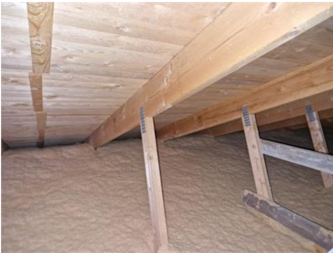
Vind i allmänhet.