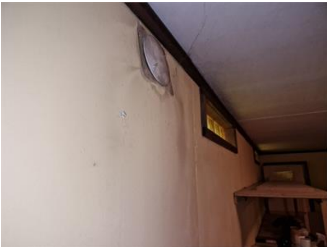
Fuktskada i vägg hobbyrum,