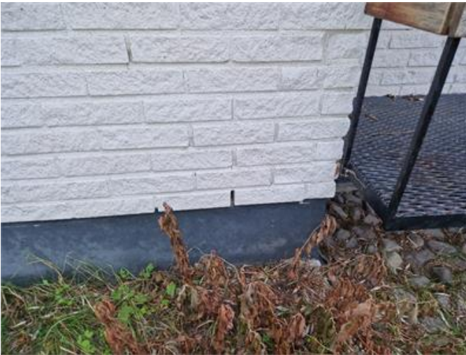
Sprickor förekommer i fogar på kalksandsten.