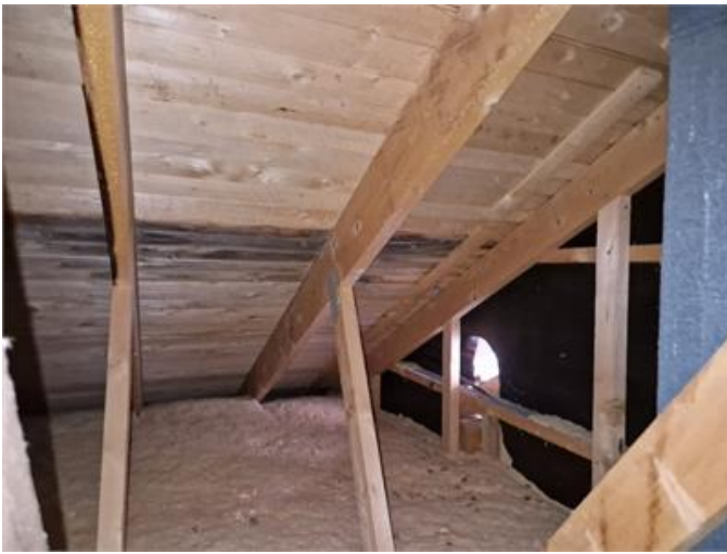
Lokal missfärgning på vind.