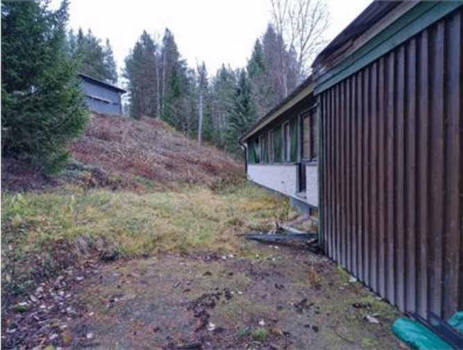
Mark lutar mot hus.